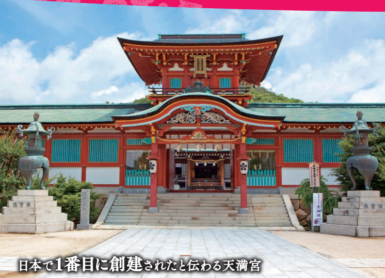
日本で1番目に創建されたと伝わる天満宮