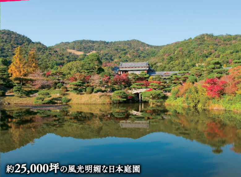
約25,000坪の風光明媚な日本庭園