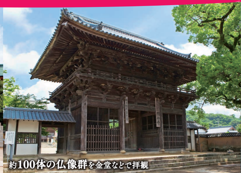
約100体の仏像群を金堂などで拝観