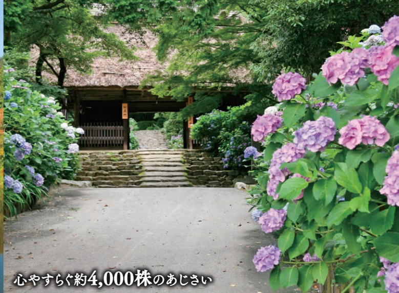
心やすらぐ約4,000株のあじさい